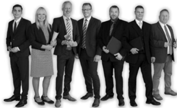
Unser Verkaufsteam an der Alster